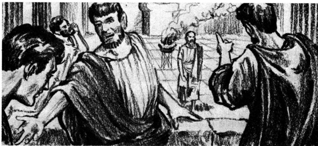
Sócrates fue atacado con crueldad ante los jueces.

convinimos en aceptar los fallos con que la ciudad hace justicia?... ¿Qué tienes contra nosotras y la ciudad para que quieras destruirnos? Bajo estas leyes fuiste concebido; protegido por estas leyes tu padre se casó con tu madre y te dieron el ser. ¿Qué tienes que reclamar a las leyes que amparan al matrimonio?