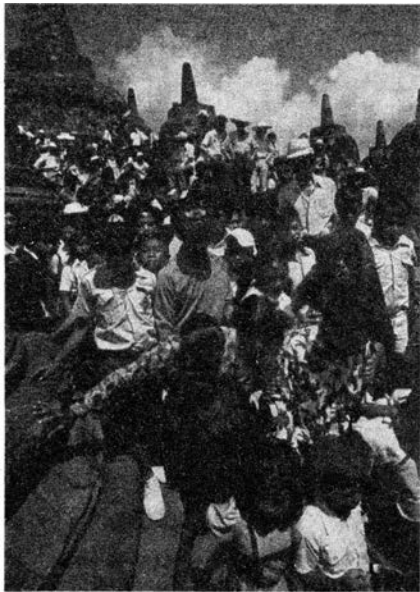
Miles de personas visitan el templo todos los años.

las imágenes talladas en las paredes recuerdan la pobreza, la enfermedad y la muerte que existe en el mundo. En el cuarto corredor se ve cómo las personas deben alejarse de las tentaciones de la carne y dejar atrás las cosas del mundo y la vida material. Al terminar el quinto corredor se recuerda cómo se puede entonces pasar a la meditación y a la reflexión. En el sexto corredor las imágenes enseñan cómo el peregrino consigue así estar en total paz y armonía con su