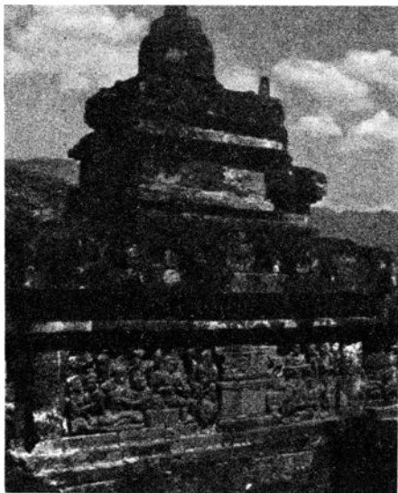
Escenas talladas en relieve de la vida santa que llevó Buda en la tierra. Arriba, una de las 72 Stupas pequeñas o cúpulas con estatuas de Buda y que están en los últimos tres corredores del templo.

Del tercer corredor en adelante Borobudur muestra, por medio de imágenes y estatuas talladas en las paredes de piedra, la vida de Buda en la tierra. En el tercer corredor